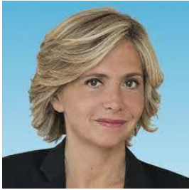
Île-de-France Valérie Pécresse