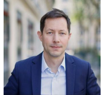
Chef de la délégation française au PPE François-Xavier Bellamy