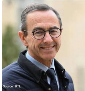
Sénateur Bruno Retailleau