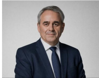
Haut-de-France Xavier Bertrand