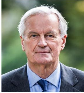
Député, Ancien commissaire européen Michel Barnier