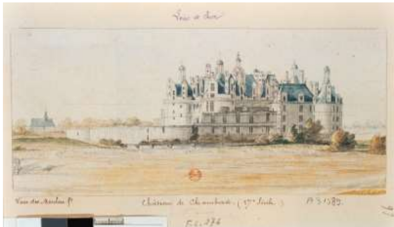
Van der Meulen, Vue du château de Chambord, XVII e siècle Bibliothèque nationale de France, EST RESERVE VE-26 (K) LIBRE DE DROITS