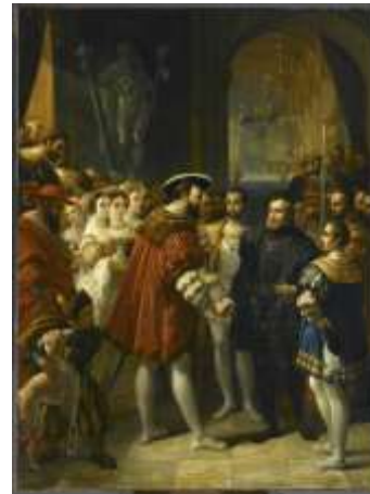
Alexandre Colin, Charles Quint reçu au Louvre par François I er en 1540, 1843 Musée du Louvre : INV3304 LIBRE DE DROITS