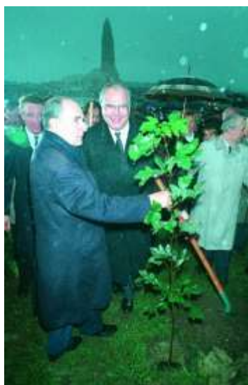
François Mitterrand et Helmut Kohl plantent l'arbre de l'amitié près de Douaumont, 22 septembre 1984