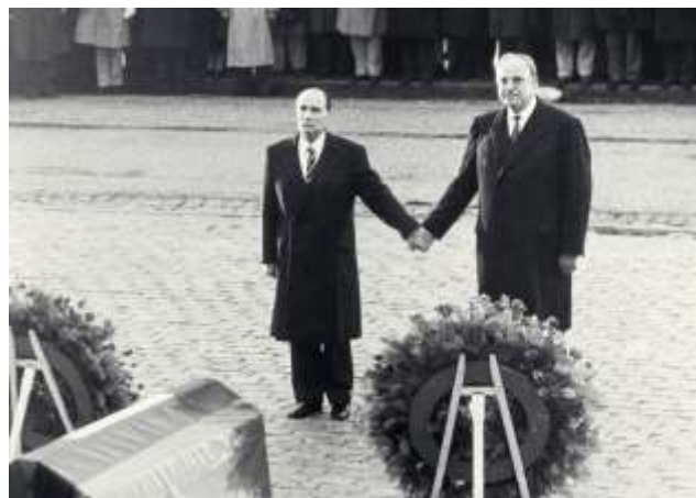
François Mitterrand, président de la République Française et Helmut Kohl, chancelier de la République fédérale d'Allemagne, se recueillent et s'inclinent ensemble sur les tombes des soldats allemands et français (Verdun, Meuse, région Lorraine).