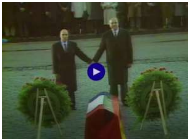
Extrait vidéo : la poignée de main Mitterrand-Kohl du 22 septembre 1984

INA - https://www.ina.fr/ina-eclairer-actu/ossuaire-douaumont-francois-mitterrand-helmut-kohl-mains-catafalque-reconciliation