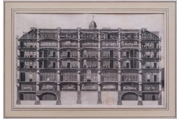
Coupe prise sur la ligne N.O. du plan des hôtels de la Guerre, Marine et Affaires étrangères". Vers 1774-1775