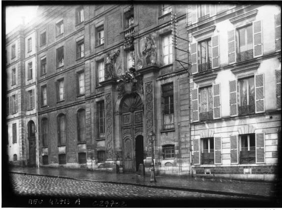
Versailles : porte et bibliothèque de Versailles, 1927 Bibliothèque nationale de France : El 13-2806