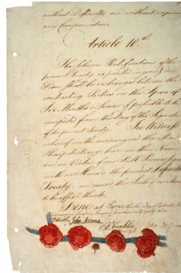
Dernière page du traité de Paris - article 10, signatures et cachets, 3 septembre 1783