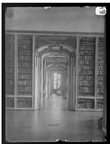
« Galerie des Affaires étrangères » : vue de la « salle des Traités » et de la « salle Berthier » Bibliothèque municipale de Versailles : PHOTOS PV G 3