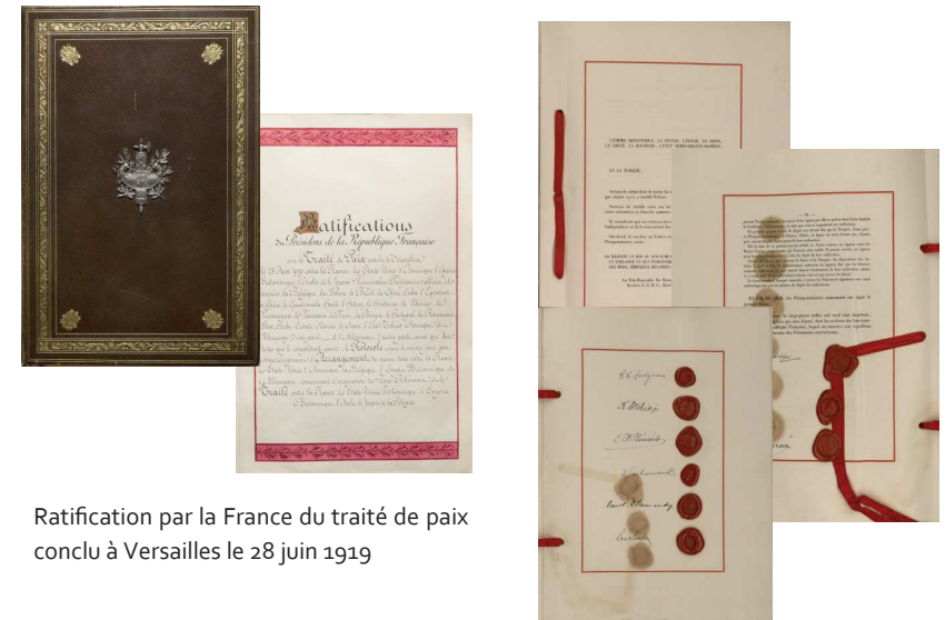
Ratification par la France du traité de paix conclu à Versailles le 28 juin 1919

Placé sous l'angle patrimonial, le colloque a pour ambition de révéler aux chercheurs la richesse de sources méconnues, parfois fragilisées par une histoire mouvementée et posant encore question (que sont devenus les traités dérobés ?). Organisé à l'occasion du centenaire de la fin de la Grande Guerre, en marge de l'exposition « A l'Est. La guerre sans fin » (5 octobre 2018-20 janvier 2019), il propose aussi de faire le point sur la publication de ces sources et sur leur médiation, dans le cadre de l'exposition, mais aussi à l'étranger, notamment dans les Etats d'Europe centrale nés de l'effondrement des empires centraux où ce patrimoine est porteur d'enjeux mémoriels.