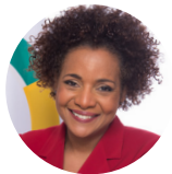
Michaëlle Jean Secrétaire générale de la Francophonie

Le Grand Tour : Voyage en Francophonie, c'est également un grand rendez-vous avec l'histoire d'une humanité qui se dit en français.