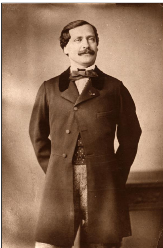
Portrait de Maxime Outrey, ancien ministre de France à Tokyo (vers 1880). (Ministère des Affaires étrangères, collection iconographique : G1a-147 / photothèque : A006658).