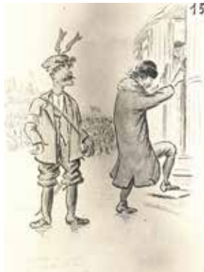
Caricatures de Provost, 1918. Membres du corps diplomatique et étrangers.