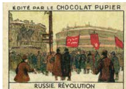
Chromolithographie Chocolat Pupier, 1932.

Ces journées d'étude sont organisées par les Archives diplomatiques, les Archives nationales et le Centre d'études des mondes russe, caucasien et centre européen [CERCEC].