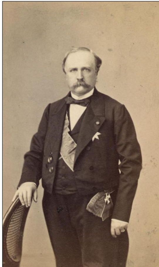
Portrait de Gustave de Reiset, ministre plénipotentiaire à Hanovre, 1866. (Ministère des Affaires étrangères, A003168)