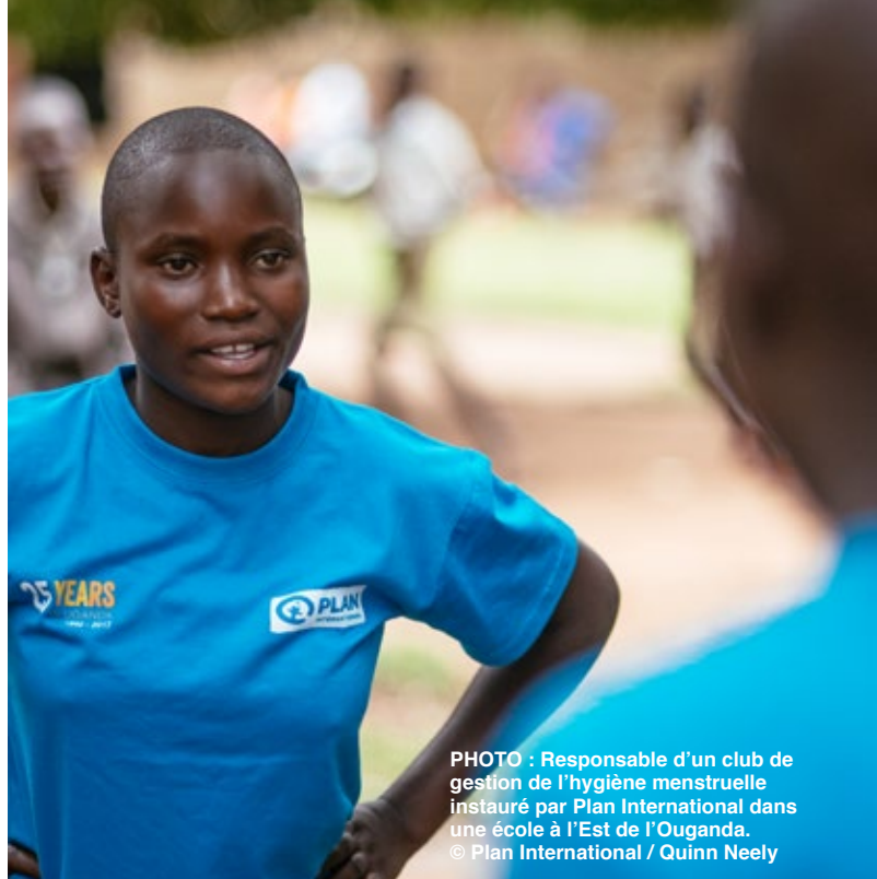
PHOTO : Responsable d'un club de gestion de l'hygiène menstruelle instauré par Plan International dans une école à l'Est de l'Ouganda.

Les rôles familiaux traditionnels étaient aussi relevés, et mal perçus, par les filles interrogées en Espagne :