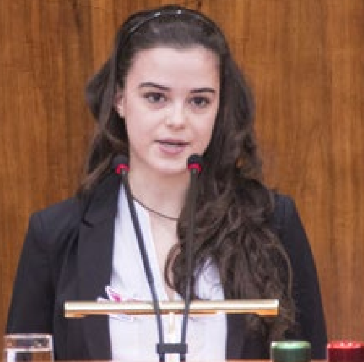
PHOTO : Un membre du comité consultatif des jeunes en Espagne prend la parole au parlement espagnol.