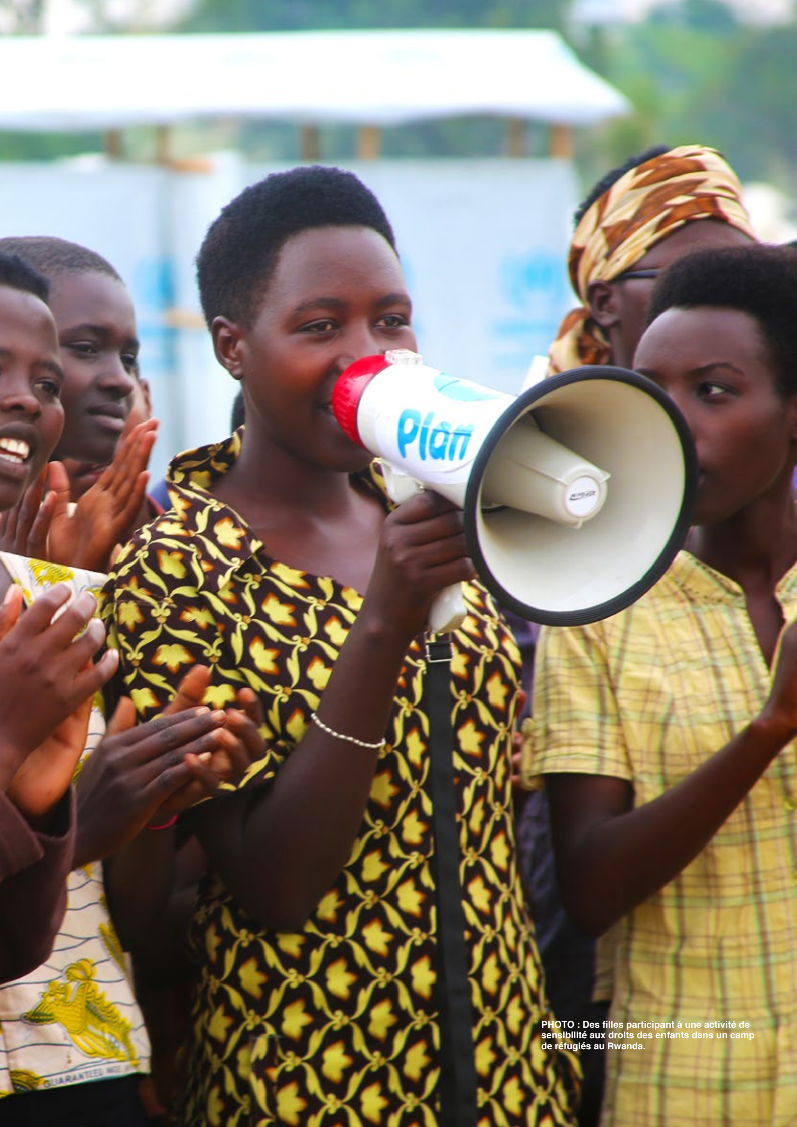
PHOTO : Des filles participant à une activité de sensibilisation aux droits des enfants dans un camp de réfugiés au Rwanda.