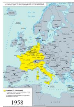
L'Europe de 1958