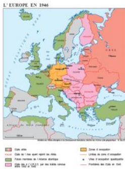
L'Europe de 1946