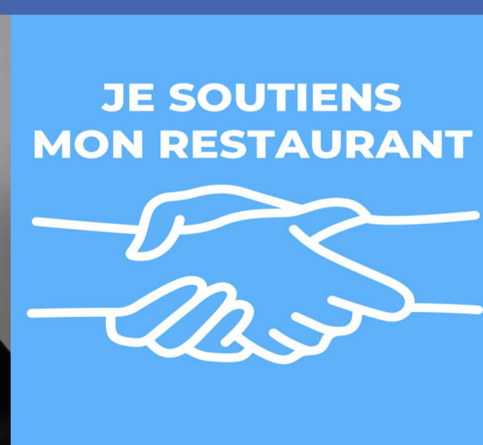
16. Sandrine Blanquet Restauratrice 🇫🇷