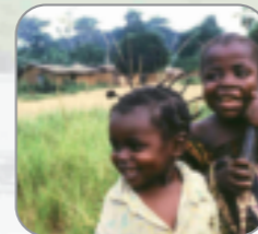
A regional platform of expertise dedicated to natural resources management by and for local communities.