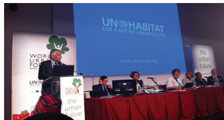
Hubert Julien-Laferrrière, vice-président du Grand Lyon, lors de la session spéciale d'ONU-Habitat sur la décentralisation et l'accès aux services de base.

multi-acteurs qu'il a permis de faire émerger, dans la lignée des « Orientations de la coopération française en appui à la gouvernance urbaine démocratique » publiées en 2009.