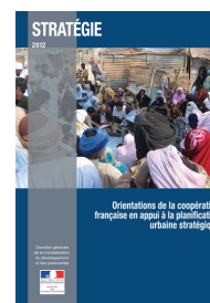
Les Orientations de la coopération française en appui à la planification urbaine stratégique 2012 est disponible en ligne.

Les partenaires internationaux ont salué le caractère novateur du PFVT.