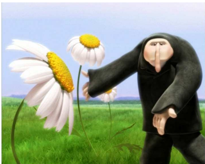
Cycle Enfantillages, James Monde, Soandsau

Le cinéma d'animation français est présenté au CCBB de Brasília en 60 courts-métrages répartis en 6 thèmes. La richesse des scénarios, la maîtrise de la technique, le talent des cinéastes ainsi que le dynamisme des producteurs sont les ingrédients de l'important développement qu'a connu le cinéma d'animation français, présenté ici avec ce festival. Avec le Commissariat du Festival d'Animation d'Annecy et le partenariat de la Cinémathèque de l'Ambassade de France.