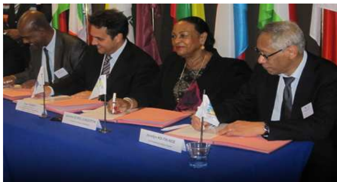
Les Présidents des Régions Ultrapériphériques française inaugurent l'Antenne des RUP à Bruxelles

Le 1 er février 2013 : Inauguration du bureau des Régions Ultrapériphériques françaises à Bruxelles.