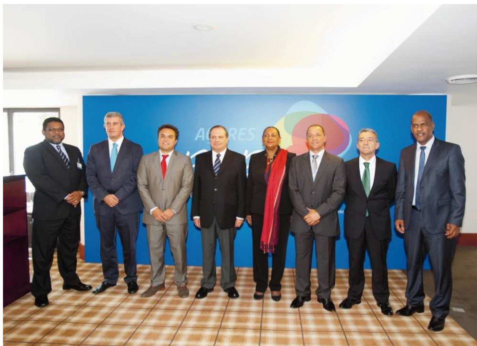
XVIIIème Conférence des Présidents des RUP aux Açores en septembre 2012