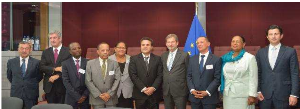
Les Présidents des Régions Ultrapériphériques à la Commission européenne le 25 juin 2013