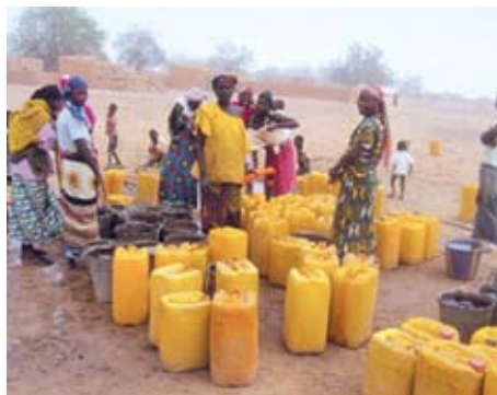
Acceso al agua potable en Níger - Dankassari / Cesson-Sévigné