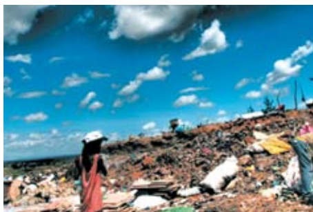
Gestión de residuos en Mozambique -- Maputo y Matola / Diputación Provincial de Seine-Saint-Denis