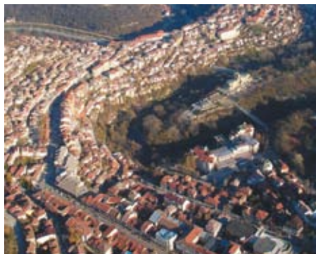
Patrimonio y gobernanza urbana: Veliko Turnovo (Bulgaria) / Bayona