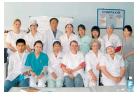
Apoyo a los profesionales de la salud en Mongolia – Aimag de Uvurkhangai / Diputación Provincial de Allier