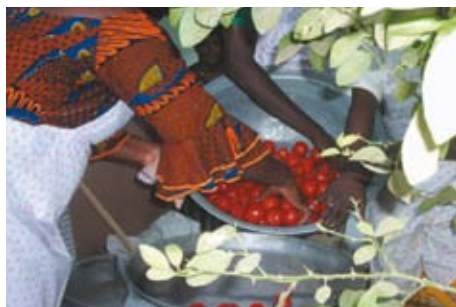
Economía verde y justa en Burkina Faso